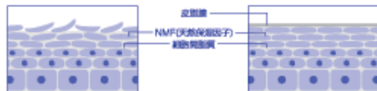
バリア機能が低下した肌の状態

ナノとは10億分の1のミクロな世界を示す単位。 「アルージェ」は、敏感肌・乾燥肌・不安定肌のために、 超高压乳化法というミクロを超えた「ナノ粒子」技術を 応用しています。 このナノ粒子は、角質層に浸透して肌をやさしく、みず みずしく整えます。さらに、べとつかず快い使い心地で、 乱れがちな角質層をパールのようにつつみ、健康で美しい 肌質へと導きます。