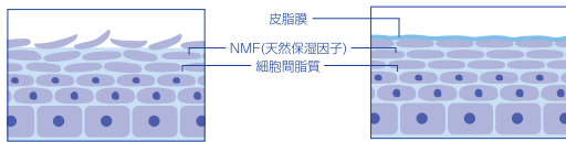
バリア機能が低下した肌の状態

ナノとは10億分の1のミクロな世界を示す単位。 「アレルギー」は、敏感肌・乾燥肌・不安定肌のために、 製剤化技術を研究し、ミクロを超えた「ナノ粒子」技術を採用しました。 配合したナノモイスチャー成分が、心地よくマイルドな 使用感を実現し、洗い上がりの肌に、しっとり感をもちます。