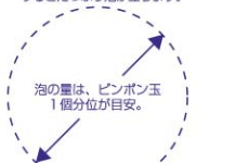
泡の量は、ピンポン玉 1個分位が目安。

●一度立てた泡を片方の手のひらにのせ、 もう片方の指先で空気を入れ込むよう にするとたっぷり泡が立ちます。